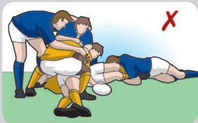
Giocatori a terra che giocano il pallone sul placcaggio