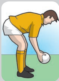
Introduzione in mischia