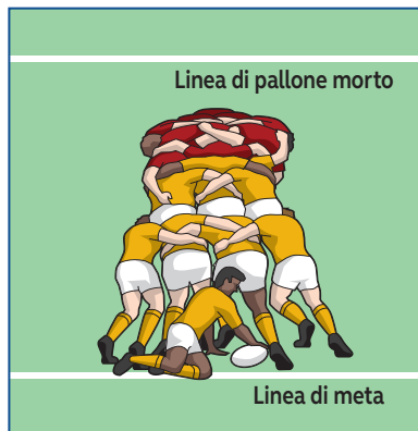
Segnare una meta – quando una mischia raggiunge la linea di meta