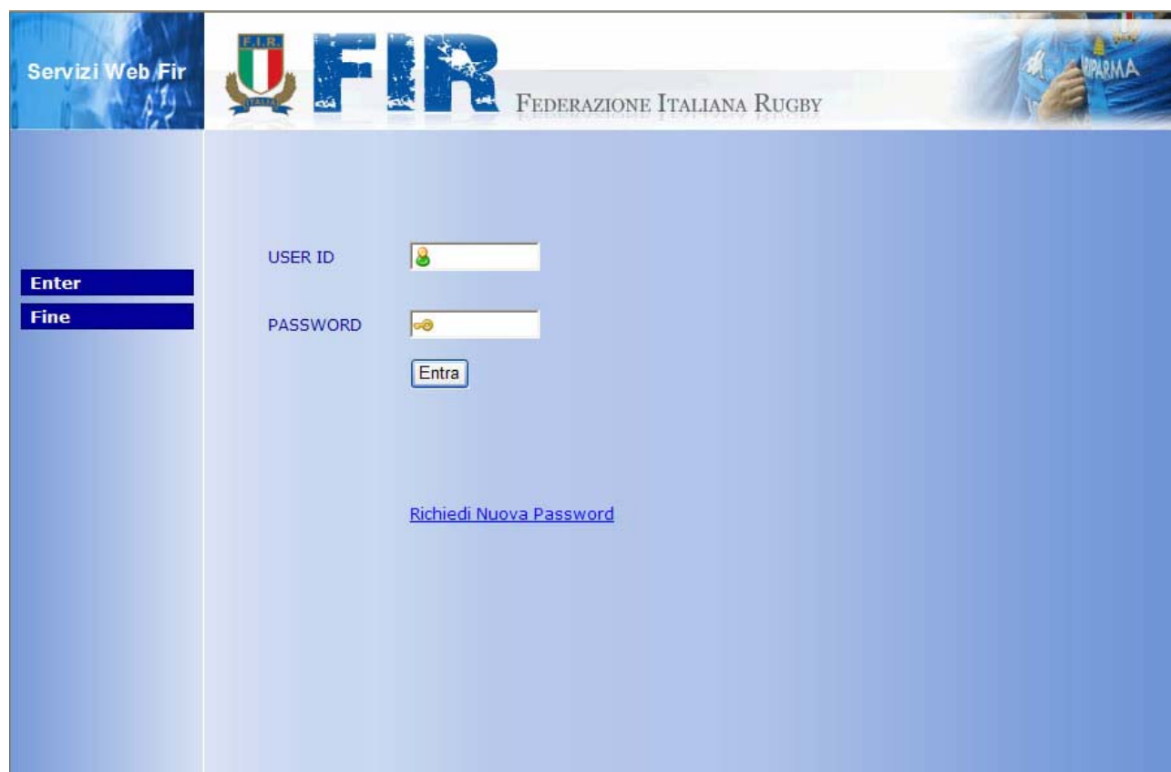
Figura 1 Login

All'apertura della pagina verrà richiesto lo USER ID e la PASSWORD.