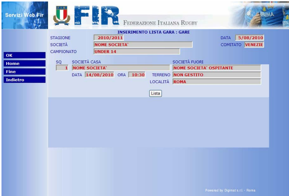
Figura 13 Gestione Lista Gare – Partite

Cliccare sul pulsante “lista” per aprire nel dettaglio la lista dei giocatori.