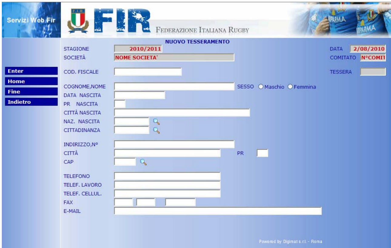
Figura 3 Nuovo Tesseramento