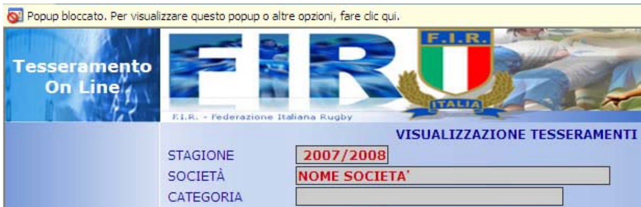
Figura 7 Popup Bloccato

Le impostazioni del browser possono condizionare l'apertura della nuova finestra per la visualizzazione della stampa. Fare click sul messaggio: "Popup bloccato..Per visualizzare[..]" e cliccare su Consenti sempre popup da questo sito.