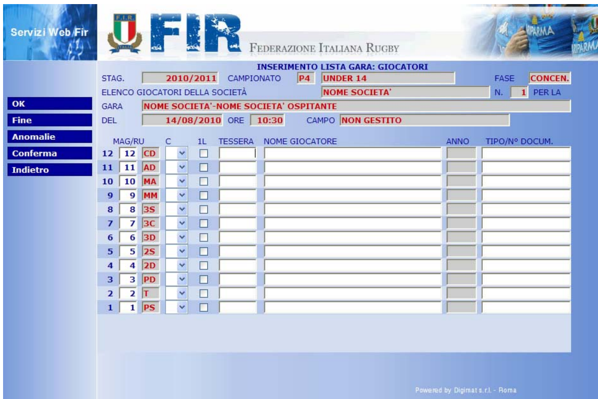
Figura 13 Gestione Lista Gare - Lista Giocatori

Cliccare sul pulsante “lista” per aprire nel dettaglio la lista dei giocatori.