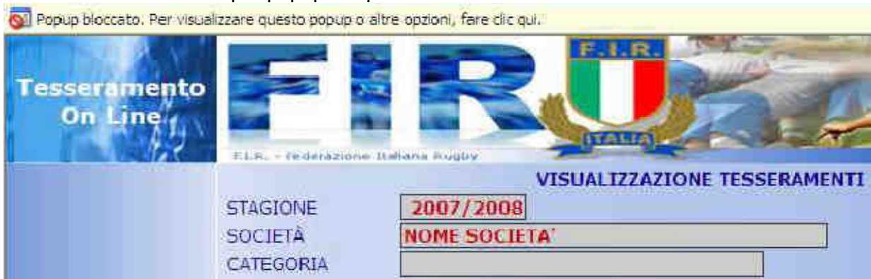
Figura 5 esempio di Popup Bloccato

NB: Le impostazioni del browser possono condizionare l'apertura della nuova finestra per la visualizzazione della stampa. Fare click sul messaggio: "Popup bloccato..Per visualizzare[..]" e cliccare su Consenti sempre popup da questo sito.